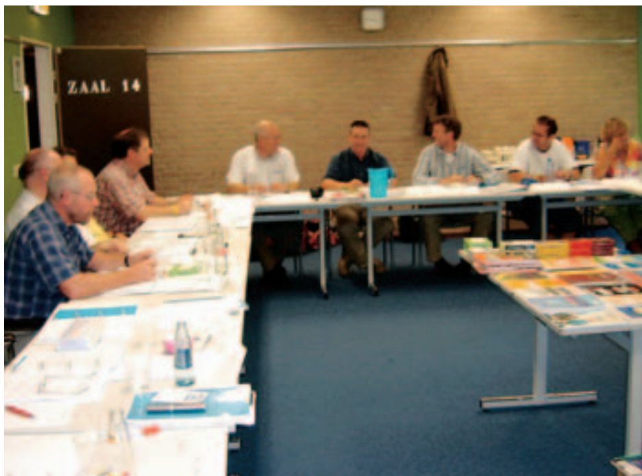
CPOB-directies tijdens de tweedaagse IPB-cursus

directeur Kon. Beatrixschool te Culemborg