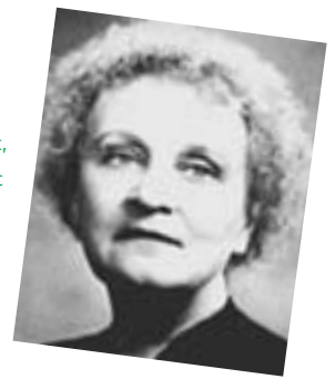
Helen Parkhurst, grondlegster van het Dalton onderwijs